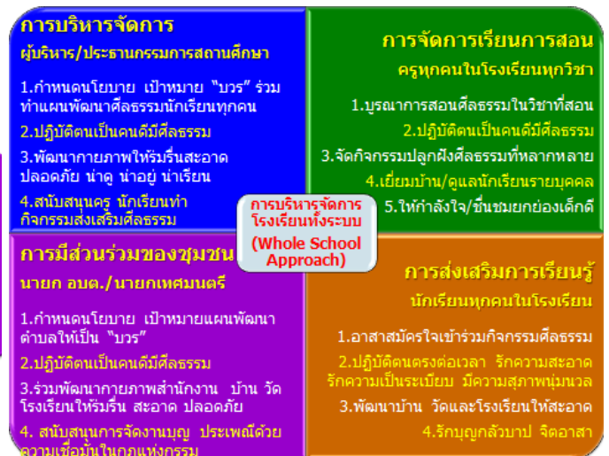
แผนภาพ ๓ การบริหารจัดการโรงเรียนทั้งระบบ