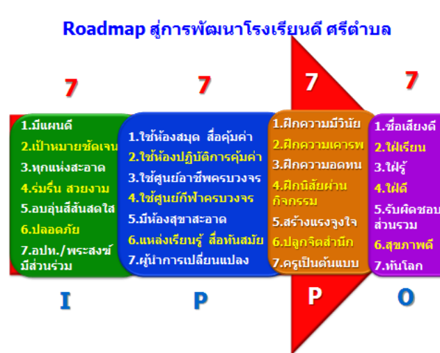
แผนภาพ ๒ นโยบาย ๗-๗-๗-๗ โครงการโรงเรียนดี ศรีตำบล

ผลการประเมินและผลการวิจัย พบว่า กระแสตอบรับของบุคลากรที่ผ่านการสัมมนาเป็นไปอย่างดีทั้งในเชิงปริมาณและคุณภาพ สามารถนำไปใช้พัฒนาคุณภาพโรงเรียนผ่านการบริหารจัดการโรงเรียนทั้งระบบ และการอบรมบ่มเพาะให้เกิดคุณลักษณะนิสัยที่ดีให้กับนักเรียนใน ๖,๕๕๕ โรงเรียน จำนวน ๑,๗๑๒,๙๑๘ คน ให้มีคุณธรรม จริยธรรม รู้เท่าทันและเตรียมพร้อมเข้าสู่ประชาคมเศรษฐกิจอาเซียน (AEC) ในต้นปี ๒๕๕๙