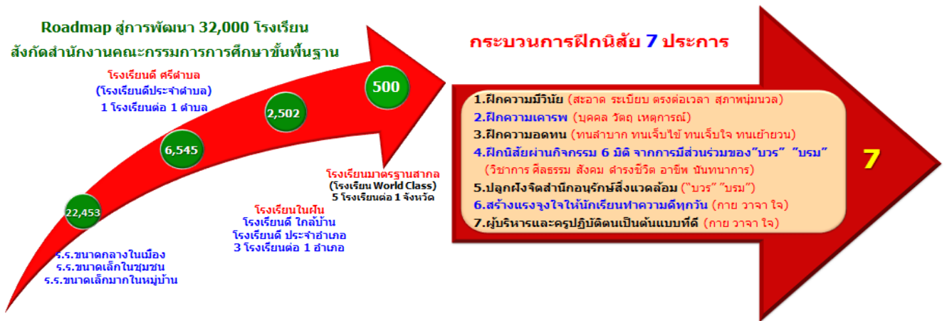
แผนภาพ ๔ Roadmap การพัฒนา ๓๒,๐๐๐ รร.สังกัด สพฐ.

โรงเรียนในฝันถือเป็นโรงเรียนสาธิตของกระทรวงศึกษาธิการ จึงใช้คำว่า “Lab School” ผ่านการคัดเลือกเข้าโครงการโดยผู้ว่าราชการจังหวัดเป็นประธาน ให้นายอำเภอ กำนัน ผู้ใหญ่บ้าน ผู้แทนชุมชนแต่ละตำบลร่วมกันคัดเลือกให้เหลือเพียงอำเภอละ ๑ โรงเรียนในแต่ละรุ่น ปัจจุบันมีทั้งหมด ๓ รุ่น กระจายอยู่ ๙๒๑อำเภอ/เขต ทั่วประเทศ โดย Roadmap โรงเรียนในฝันคือการเตรียมเข้าสู่โรงเรียนมาตรฐานสากล ตามแผนภาพ ๔