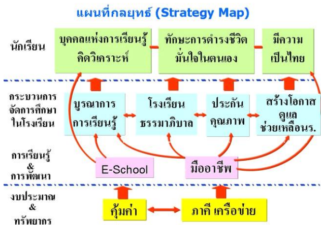
แผนภาพ ๖ แผนที่กลยุทธ์ปัจจัย กระบวนการ ผลผลิต

ทั้งนี้ โครงการได้สร้างแผนที่กลยุทธ์ (Strategy Map) ขึ้น โดยดำเนินการตามหลัก Balanced Scorecard เพื่อใช้เป็นดัชนีชี้วัดสภาพความสำเร็จ (Key Performance Indicator; KPI) ในการพัฒนาดตนเองและใช้ตัดสินผลการประเมินรับรองต้นแบบโรงเรียนในฝัน โดยมีปัจจัย กระบวนการ ผลผลิต และเพิ่มกระบวนการฝึกนิสัยให้นักเรียน มีวินัย เคารพ อดทนอีก ๗ ประการ ตามแผนภาพ ๕, ๖ และ ๗ ดังนี้