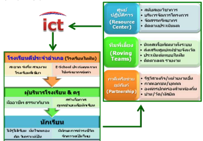
แผนภาพ ๗ ภาควิชาเครือข่ายสนับสนุนโรงเรียนในฝัน